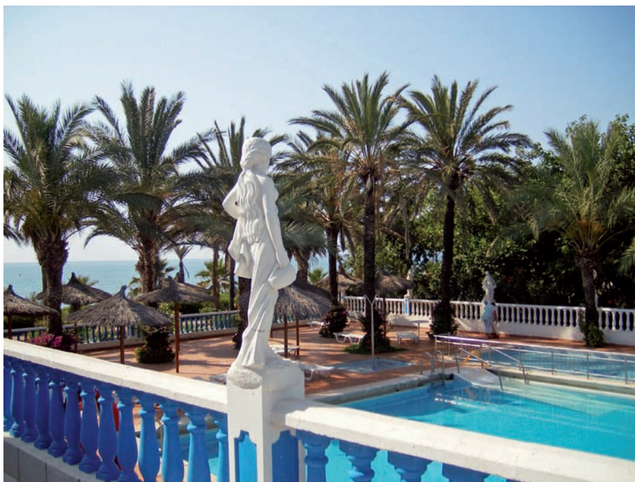
Imagen de la piscina del camping Playa Tropicana (Castellón).

Aunque muy diferentes, todas coinciden en una cosa: el trabajo es, por supuesto, esfuer-