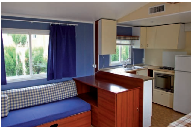
Interior de un bungalow del camping Bellavista (Murcia).